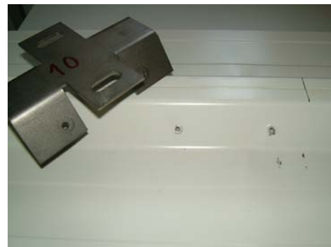
Ansicht nach Maximalbelastung