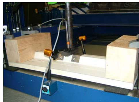
Prüfling unter Last